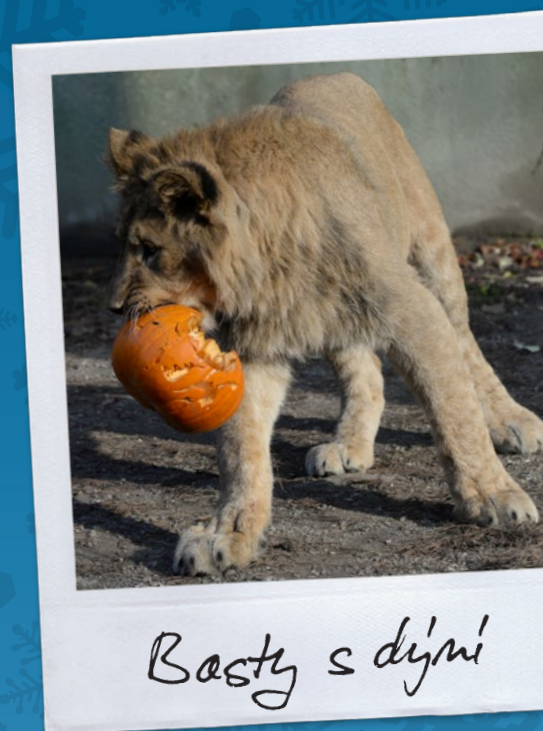
Basty s dýní

Zoo bývá na Večer duchů bohatě vyzdobená dýněmi, které ještě po nějaký čas necháváme v areálu. Ale pak nastane otázka kam s nimi? Naši zoologové a chovatelé vymysleli akci v rámci enrichmentu, neboli obohacení životního prostředí zvířat, jak se dá tento termín také přeložit. Ten slouží především k vyplnění volného času chovaných živočichů, a proto dostala vybraná zvířata do svých ubikací a výběhů dýně naplněné pamlsky. V letošním roce jsme strašidelnými dýněmi podělili lemury kata i lemury tmavé, siamangy, kočkodany husarské, nosály červené, tygry ussurijské, lvíčata lvů berberských, kotuly i oba druhy mravenečníků. Některá zvířata se napřed trochu ostýchala a ke strašidelným dýním přistupovala s respektem, ale třeba lemuři, nosáli, lvíčata Terry a Basty a tygřice Betty z nich měli opravdovou radost a nové hračky si jaksepatří užili, jak je patrné i z přiložených fotografií.